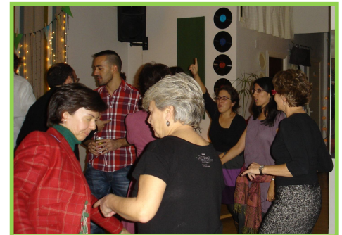
Conversación y bailes en la cena-cóctel