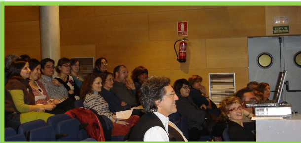
Un momento de la Asamblea

En el apartado de ruegos y preguntas se comentó la oportunidad que se tiene para recuperar la autoridad regional de salud pública, dada la proximidad de las elecciones. Del mismo modo se habló de la influencia de la actual crisis económica y sus consecuencias en la salud de los madrileños y de la necesidad de realizar más actividades para los socios y de marketing social de salud pública. Otro de los debates surgió a raíz de la propuesta de participar como asociación en SESPAS.