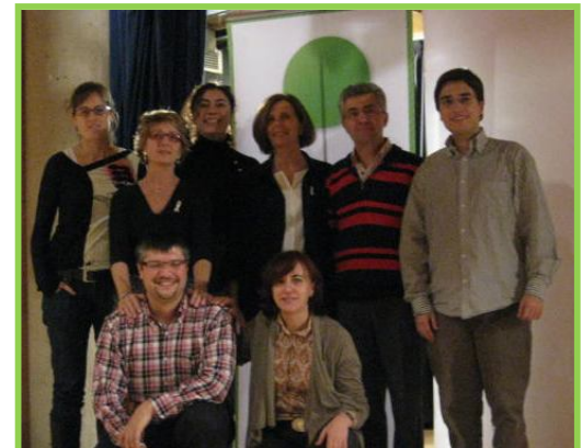
Y damos la bienvenida a los nuevos integrantes