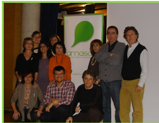
Nos despedimos de la antigua Junta Directiva, ¡gracias por vuestro esfuerzo!